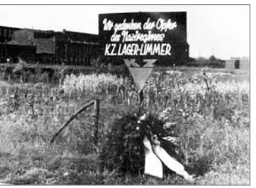
■ Gedenktafel des »Hauptausschusses ehemaliger politischer Häftlinge«, September 1947. Im Hintergrund die Fabrikgebäude der Continental.

»Wir hatten beschlossen, unseren Nationalfeiertag offen durch eine Schweigeminute zu ehren. Am 14. Juli 1944 haben wir uns alle um 12 Uhr mittags in der Fabrik Continental erhoben. Die ›Mäuse‹ betrachten uns verdutzt und böse. Eine von ihnen telefonierte zum Block: ›Es beginnt ein Aufruhr. Sie schreien: ›Setzen, Ruhe!‹, und wir bekommen die ersten Schläge. Wir setzen uns, immer noch in absolutem Schweigen: die Minute war vorbei.«