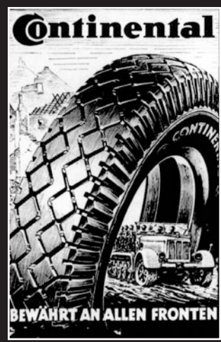
■ Werbeplakat der Continental aus der Zeit des 2. Weltkriegs.

■ Alle Zitate in den Fußzeilen stammen aus Berichten ehemaliger Häftlinge über das Frauen-KZ Limmer.