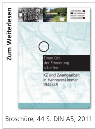
Broschüre, 44 S. DIN A5, 2011

Die Continental profitierte nicht nur von der Sklavenarbeit der KZ-Häftlinge. Auf dem Gelände neben dem Werk befand sich auch ein Lager für mindestens 1 220 ausländische Zwangsarbeiter/-innen. Ende 1944 waren rund 40 Prozent der Arbeitskräfte in Hannover Zwangsarbeiter/-innen oder Häftlinge.