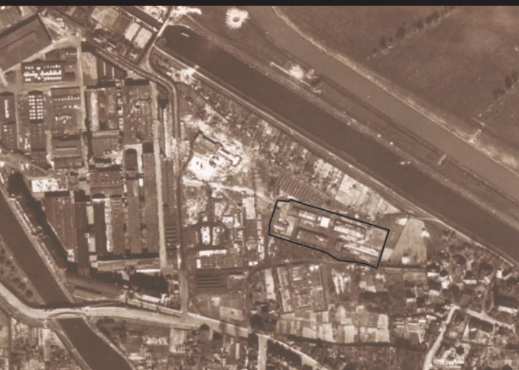
■ Luftbild des ehemaligen Frauen-KZs Limmer, April 1945. Südlich und westlich des KZs sind die Fundamente der Baracken des ehemaligen Zwangsarbeiterlagers zu erkennen.