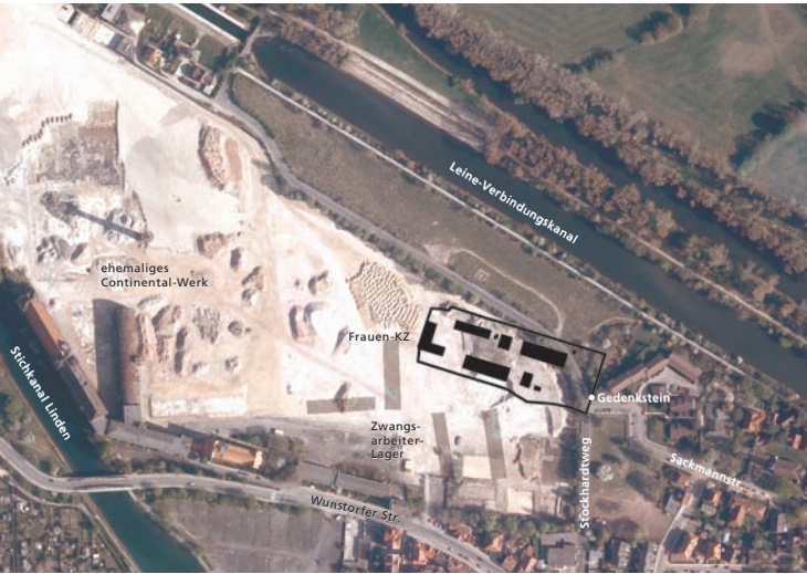
■ Lage des ehemaligen Frauen-Konzentrationslagers und des Zwangsarbeiterlagers im heutigen Luftbild. Laut aktuellem Bebauungsplanentwurf der Landeshauptstadt Hannover für die »Wasserstadt Limmer« ist in der nordöstlichen Ecke am Leine-Verbindungskanal eine öffentliche Grünfläche vorgesehen, in der eine »Frauen-KZ-Gedenkstätte« gestaltet werden soll. Der überwiegende Teil des ehemaligen KZ-Geländes soll mit Wohnhäusern bebaut werden.

■ Alle Zitate in den Fußzeilen stammen aus Berichten ehemaliger Häftlinge über das Frauen-KZ Limmer.