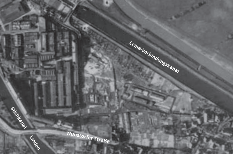
■ Luftbild des ehemaligen KZ Conti-Limmer, April 1945. Daneben sind Fundamente und Bauten des ehemaligen Zwangsarbeiterlagers zu erkennen.