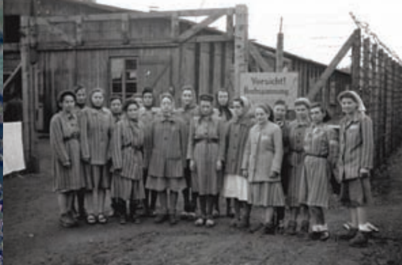
■ Gefangene des Frauen-Konzentrationslagers Conti-Limmer nach ihrer Befreiung vor einer Baracke des KZ.