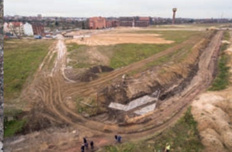
■ Von der Stadt Hannover finanzierte archäologische Grabungen 2015. Oben Boden einer Häftlingsbaracke, unten Pfostengruben der Zäune.

Im hannoverschen Stadtteil Limmer befand sich von Ende Juni 1944 bis Anfang April 1945 ein von den Continental Gummiwerken errichtetes Außenlager zunächst des Konzentrationslagers Ravensbrück, das ab September 1944 dem Konzentrationslager Neuengamme unterstellt wurde. Interniert waren dort zuletzt über 1000 Frauen. Es handelte sich größtenteils um französische und polnische Gefangene, die als Résistance-Unterstützerinnen oder während des Warschauer Aufstands von den Deutschen gefangen genommen worden waren, aber auch um viele Frauen aus der UdSSR und einige aus anderen europäischen Ländern.