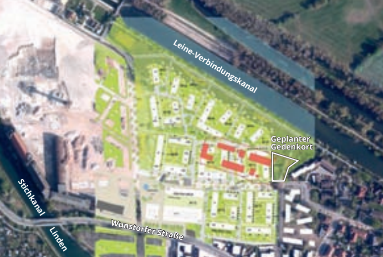
■ Lage des ehemaligen KZ Conti-Limmer und des geplanten Gedenkorts im künftigen Wohngebiet »Wasserstadt Limmer«.