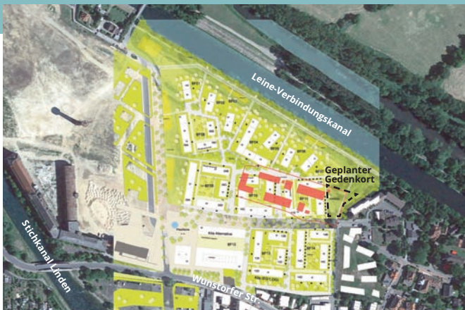
■ Lage des KZ im heutigen Luftbild mit Plan des ersten Bauabschnitts der »Wasserstadt Limmer«.

Der größte Teil des früheren KZ wird unter Wohnhäusern verschwinden, aber die nordöstliche Ecke des ehemaligen Lagers ragt in eine Grünfläche hinein, in der ein Gedenkort seinen Platz finden soll. Es ist uns ein wichtiges Anliegen, Lage und Größe des KZ wieder vorstellbar zu machen. Daher schlagen wir vor, das Lagergelände im Bereich der Grünfläche teilweise »auszugraben« und den dama-