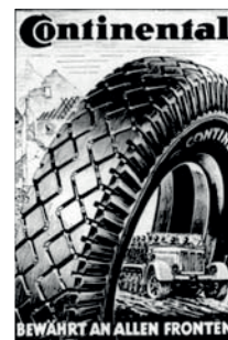
■ Conti-Werbung aus der Zeit des 2. Weltkriegs.

Am 6. April 1945 wurde das Lager geräumt und die Häftlinge wurden gezwungen, zum KZ Bergen-Belsen zu marschieren. Mindestens 26, wahrscheinlich aber deutlich mehr als 100 Frauen starben in Bergen-Belsen oder in den Monaten nach der Befreiung durch Entkräftung oder Krank-