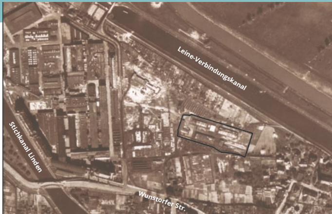
■ Luftbild des ehemaligen Frauen-KZ Limmer, April 1945. Daneben sind Fundamente und Bauten des ehemaligen Zwangsarbeiterlagers zu erkennen.

In Limmer befand sich von Juni 1944 bis Anfang April 1945 ein von den Continental Gummi-Werken errichtetes Außenlager des Konzentrationslagers Neuengamme. Interniert waren dort über 1000 Frauen. Es handelte sich größtenteils um französische und polnische Häftlinge, die als Résistance-Unterstützerinnen oder während des Warschauer Aufstands von den Deutschen gefangen genommen worden waren, aber auch um viele Frauen aus der UdSSR und einige aus anderen europäischen Ländern.