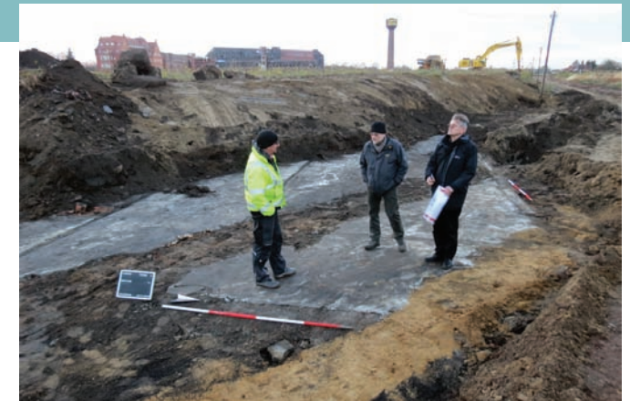
■ Von der Landeshauptstadt Hannover finanzierte archäologische Grabungen 2015.