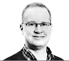
Von Simon Benne