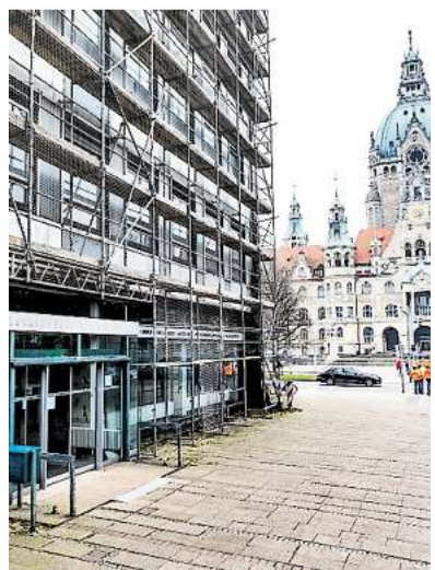
„Eine pragmatische Lösung“: Die ehemalige Volkshochschule steht seit 2015 leer.

HAZ Eine Bildergalerie unter haz.li/gedenken